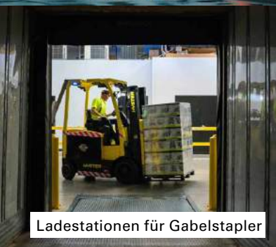
Ladestationen für Gabelstapler