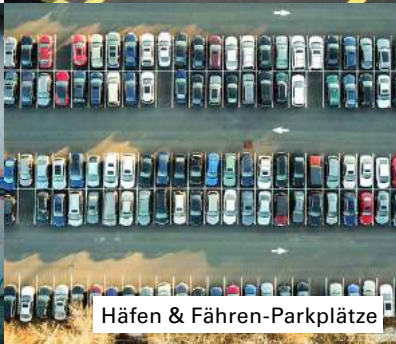
Häfen & Fähren-Parkplätze