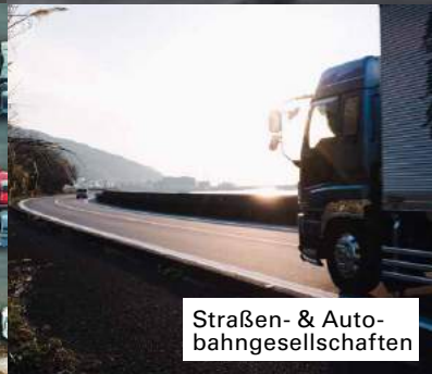
Straßen- & Autobahngesellschaften