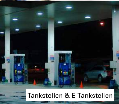
Tankstellen & E-Tankstellen