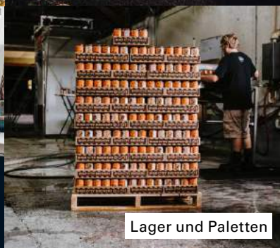
Lager und Paletten