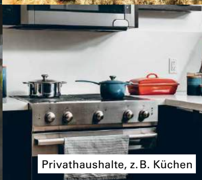
Privathaushalte, z. B. Küchen