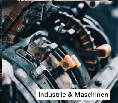
Industrie & Maschinen