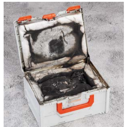
Erfolgreicher Brandversuch: die CEMO Brandschutzbox hält.