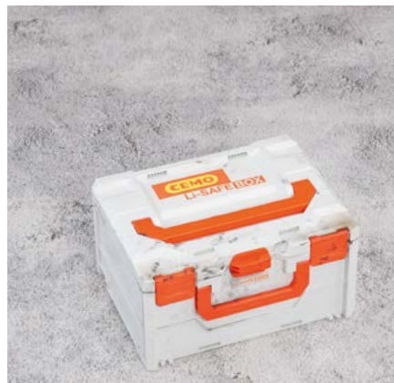
Ein MUSS, wenn Akku-Geräte im Betrieb eingesetzt werden, da der Akku jederzeit kaputt gehen kann (Brandgefahr).